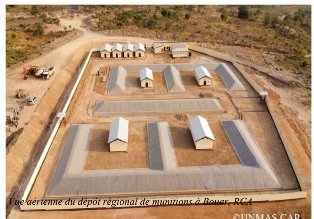
Vue aérienne du dépôt régional de munitions à Bouar, RCA

Le flux illicite d'armes et munitions compromet la stabilité de l'état de droit en RCA, ce qui ralentit les progrès vers la RESA. Les conditions de stockage des forces de défense et sécurité intérieure limitées et même inexistantes dans certaines zones, l'absence d'une législation spécifique à la GAM, ainsi que l'instabilité sécuritaire menacent la vie des civils et les possibilités de développement. UNMAS s'est pour la première fois déployé en RCA en janvier 2014 à la suite de l'adoption par le Conseil de sécurité des Nations unies de la résolution 2149 (2014), créant la MINUSCA. La tâche d'UNMAS est de soutenir les autorités nationales dans leur responsabilité de : « s'attaquer au transfert illicite, à l'accumulation déstabilisatrice et au détournement des armes légères et de petit calibre » et « d'assurer de façon sûre et efficace la gestion, l'entreposage et la sécurité des stocks d'armes légères et de petit calibre, ainsi que la collecte ou la destruction des stocks excédentaires et des armes et munitions saisies, non marquées ou détenues illicitement ». Le mandat de la MINUSCA a été renouvelé en 2021 suite à la résolution du Conseil de sécurité 2605 (2021).