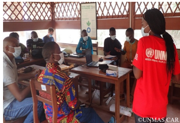
Session de sensibilisation donnée au personnel des ONG internationales par UNMAS

1. Protection des civils : Le développement de la capacité nationale en GAM contribue à atténuer les risques potentiels de vol, de pillage, d'accès et d'utilisation d'armes et de munitions en dehors du service officiel ou encore des accidents liés aux explosions de munitions stockées dans de mauvaises conditions. De plus, l'appui fourni par UNMAS dans le développement des capacités opérationnelles des forces nationales de défense dans le domaine de la destruction des armes et des munitions, participe à la réduction de leur circulation illicite et améliore la sécurité en RCA. Suite à la menace liée aux EE, le Programme donne des séances de sensibilisation au personnel des Nations unies et des acteurs humanitaires sur les risques liés aux EE ainsi que des sessions de sensibilisation de la population en RCA sur l'axe Bouar-Boali.