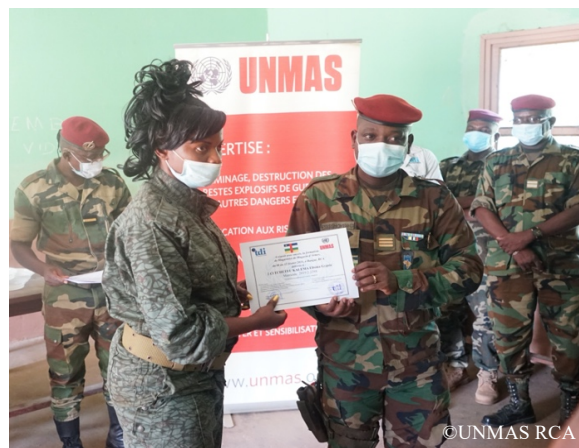
Remise de certificat de fin de formation en magasin de magasinier d'armes

2. Soutien à la restauration et l'extension de l'autorité de l'État (RESA) et à la Commission Nationale de lutte contre la Prolifération des Armes Légères et de Petit Calibre (COMNAT-ALPC) : UNMAS renforce les capacités nationales afin de permettre aux autorités centrafricaines de gérer de manière autonome les armes et les munitions à long terme, en mettant en place des infrastructures spécialisées et en renforçant les capacités nationales, à travers diverses formations spécialisées en GAM. UNMAS fournit également une assistance technique à la COMNAT-ALPC dans la mise œuvre du Plan d'action national afin de parvenir à un meilleur contrôle des ALPC et de réduire les flux illicites d'armes.